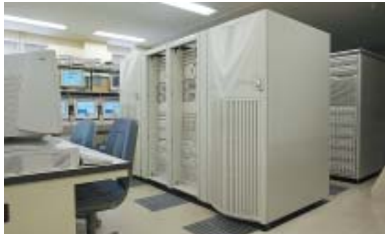
▲2台のES7000本体はアウトソーシングで外注先に設置、日本ユニシスが常時監視する体制になっている

ES7000本体はアウトソーシングで外注先に置いてあり、日本ユニシスが常時監視する体制になっている。