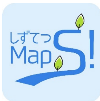
▲人と社会をつなぐアプリ「しずてつ MapS!」