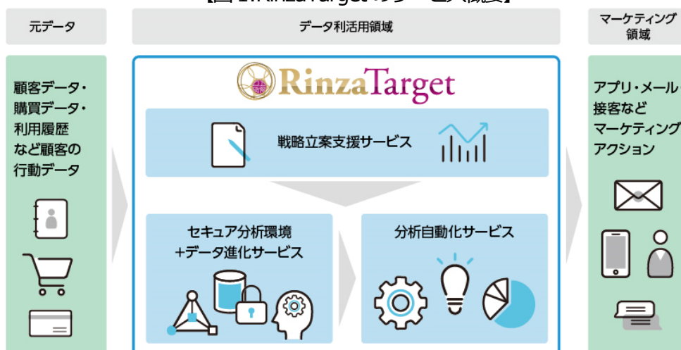
【図1:RinzaTargetのサービス概要】

「RinzaTarget」は、デジタル化によって発生するデータを活用することで、今後も発生しうる社会の変化に強い顧客との関係構築を支援します。