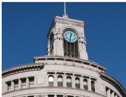
観光名所・ランドマーク